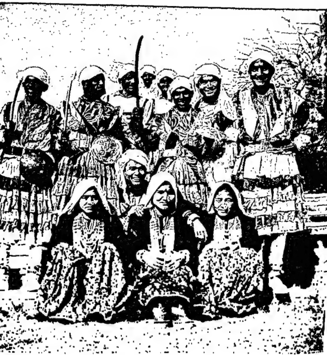
हिमालय के आदिवासी नर्तक